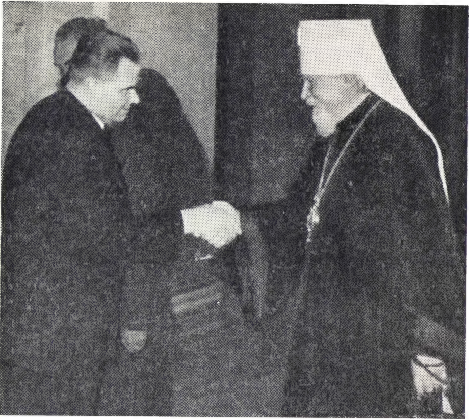
НА ПРАВИТЕЛЬСТВЕННОМ ПРИЕМЕ. МИТРОПОЛИТ НИКОЛАЙ И ПРЕДСЕДАТЕЛЬ ПРЕЗИДИУМА ВЕНГЕРСКОЙ НАРОДНОЙ РЕСПУБЛИКИ г. ДОБИ